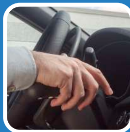
D. Spingendo il cerchietto in avanti con il pollice tenendo la mano appoggiata sulla leva freno.