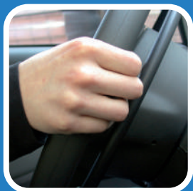
B. Spingendo il cerchietto in avanti