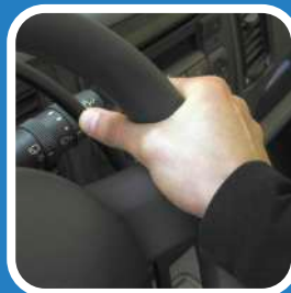
C. Spingendo il cerchietto con il pollice dall'interno del volante