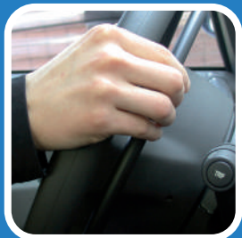
A. Tirando il cerchietto verso il volante

K5 easy-fit: permette di accelerare sia tirando il cerchietto verso il volante, sia spingendolo verso il cruscotto. L'utilizzatore può cambiare impostazione di guida in base al tipo di strada che sta percorrendo. I differenti modi di accelerare con il K5 easy-fit sono: