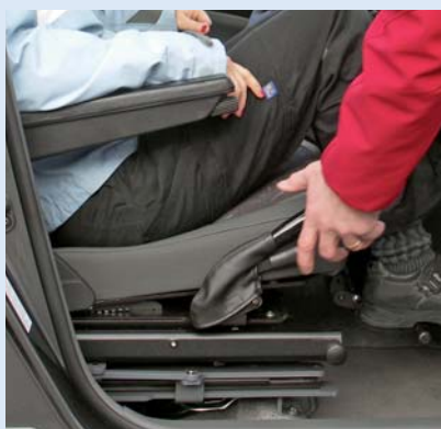
Impugna e stringi le due levette dell'impugnatura per sganciare Tilda e cambiarne la posizione