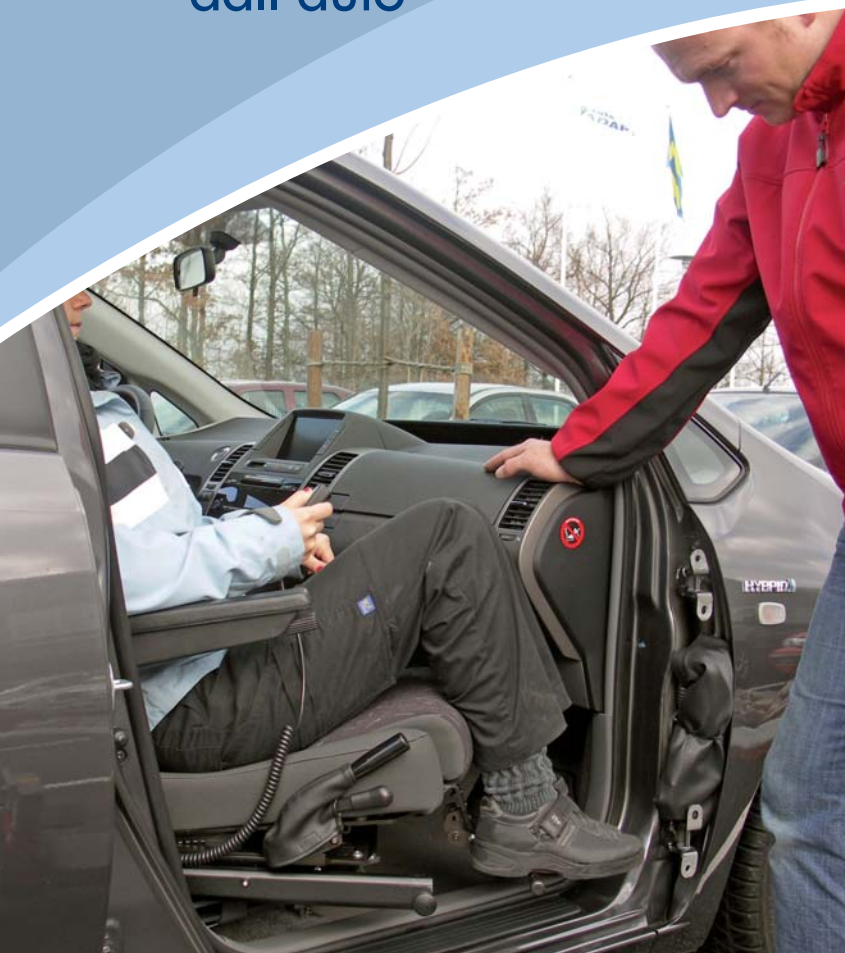
Mantenendo i piedi sull'appoggiapiedi opzionale, non è più necessario alzarli durante l'entrata e l'uscita dall'auto

Inclina il sedile e rende molto più semplice l'entrata e l'uscita dall'auto