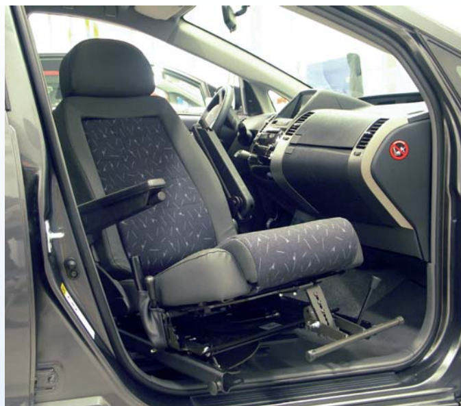
Tilda in posizione 3 in combinazione con il TURNOUT, con le guide del Carony installate su entrambi i lati L'appoggiapiedi è disponibile come optional

L'appoggiapiedi è disponibile come optional.